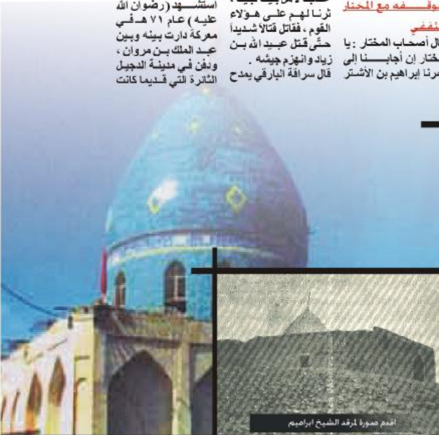
اندم صورة لمركد الشيخ ابراهيم

كان إبراهيم فارساً شجاعاً شهيداً مقداماً رئيساً ، عالي النفس بعيد الهمة ، وفي شاعراً فصيحاً ، موالياً لأهل البيت ( عليهم السلام ) ، كما كان أبوه متميزاً بهذه الصفات ، ومن يشابه أباه فما ظلم . وأخرج ابن جرير وابن المنذر عن أبي وائل قال