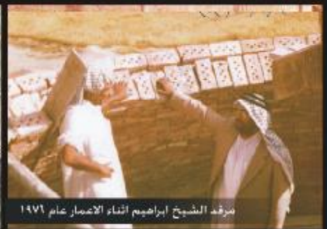
مرقد الشيخ ابراهيم اثناء الاعمار عام ١٩٧١