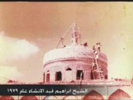
الشيخ ابراهيم قيد الانشاء عام ١٩٧٩