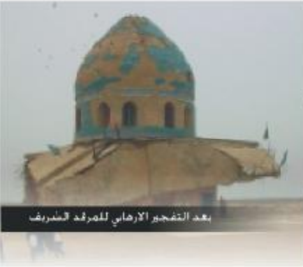
بعد التفجير الارهابي للمرقد الشاطي

قال سراقه البارقي يدح ابراهيم بن الأشتر بعد مقتل ابن زياد أتاكم غلام من عرائن منجج جري على الأعداء شو تكول جزي الله خيراً شرطه الله أنهم شفووا من عبيد الله حر غليلي