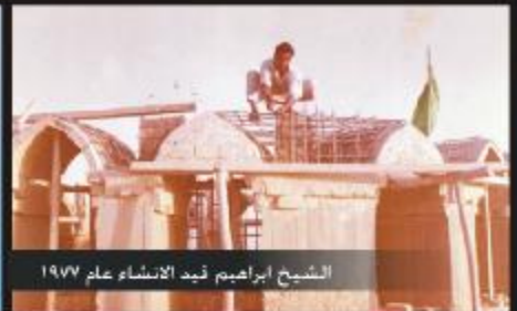
الشيخ ابراهيم قيد الانشاء عام ١٩٧٧