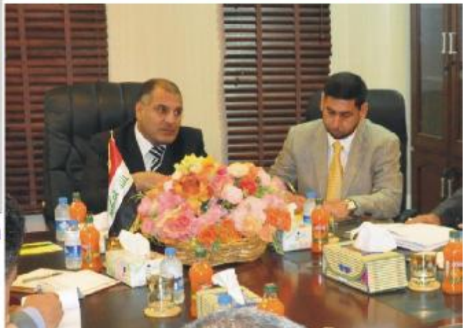
محافظ صلاح الدين / عقد في مبنى محافظة صلاح الدين اجتماعاً برئاسة احمد عبد الله عبد محافظ صلاح الدين وبحضور د. أمين عزيز جواد النائب لمتى للمحافظ. لمناقشة تنفيذ المشاريع المتلكمة والتي لم تنفذ لحد الان وتشمل تنفيذ شبكات المياه والسجاري والكهرباء وتبنيط الطرق والخدمات الأخرى. وأكد المحافظ خلال الاجتماع على ضرورة إبلاغ لشركات المنفذة بالإسراع بتنفيذ هذه المشاريع وتقديم دراسة بالمسؤوليات التي تحصل دون تنفيذ هذه المشاريع. وحضر اللقاء عدد من مدراء الدوائر الخدمية في المحافظة.

وسبق أن أكد مندوب العراق الدائم لدى جامعة الدول العربية السفير فهد العزاوي، الاثنين الماضي، أن وزراء الخارجية العرب سيعدون لاجتماعهم الاستثنائي بعد الخسب المقبل للجامعة تأجيل القمة العربية، وموضوع اختيار أمين عام جديد للجامعة العربية خلفاً لعمر موسى، فيما أكد مصدر دبلوماسي أن كل الاحتمالات مفتوحة، وفيما نحن تأمل نعدك لقمة بغداد. وسبق أن اجتمعت الجامعة العربية، في 20 من نيسان الماضي، من سدد مشاور التفتيم من عد اجتماع وزراء الخارجية العرب لبحث التطورات التي تشهدها الدول العربية، وفيما طالبت الدول بتحقيق اسلحات، ووقف العنف ضد المتظاهرين، حيث تكونت لجمعية مسؤولة بقاء مواطنيها التي تراق في سبل تحقيق الديمقراطية، من مخررة ان مقابلة حركة التاريخ هي رهن حاسر وحاد. وكان وزير الخارجية العراقي هو شيوار زبيدي ي طلب رسمياً خلال لقائه الأمين العام للجامعة العربية عمرو موسى، في نيسان الماضي، عقد اجتماع استثنائي لمجلس الجامعة العربية على مستوى وزراء الخارجية العرب بالقاهرة في 15 أيار الحالي. ينكر أن الأمين العام المساعد لجامعة الدول العربية محمد صبيح قال في وقت سابق من الشهر الماضي، إن الجامعة نسلمت طلباً من دول مجلس التعاون الخليجي لإلغاء عقد القمة العربية في بغداد، مؤكدة أنها تبحث مع الأطراف الخليجية والعربية موضوع عقد القمة بالشكل أو عقدها في مكان آخر بدلاً من العاصمة بغداد، بعد أسرار التي ان طلب جاء بسبب موقف العراق السويدي للاجتماعات المعارضات الحكومة لبحرانية.